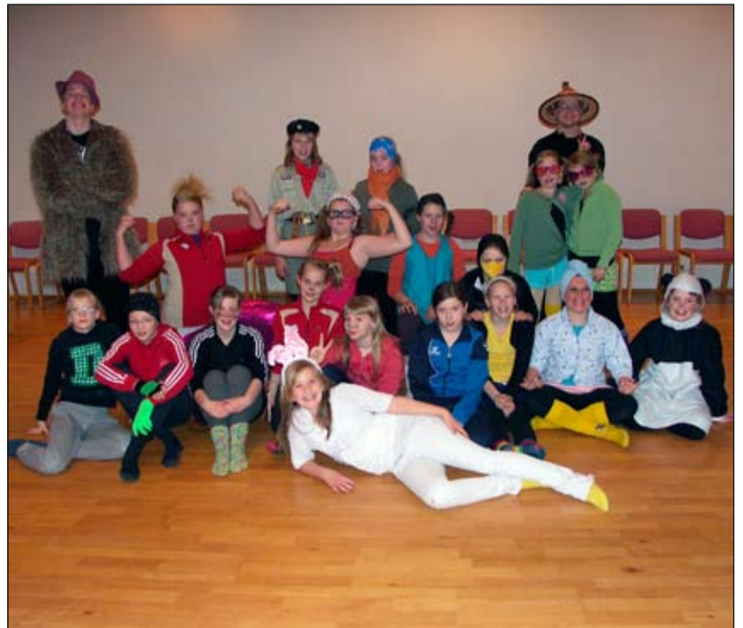
Fjör í TTT starfinu.

Við hvetjum alla, unga sem aldna til að koma og eiga góða stund í kirkjunni með okkur.