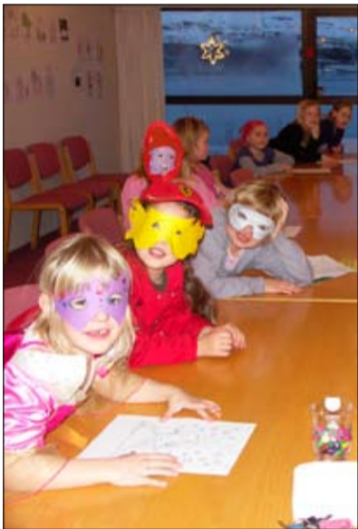
Búningadagur hjá kirkjuþrökkurum.